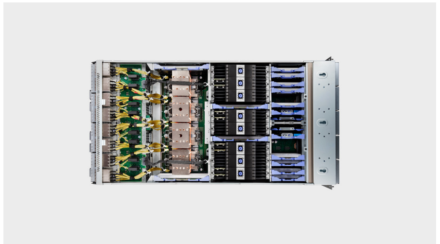
IBM Power E1080

Más información sobre SAP HANA en IBM Power →