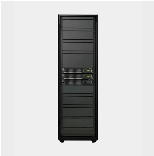
IBM Power S1022