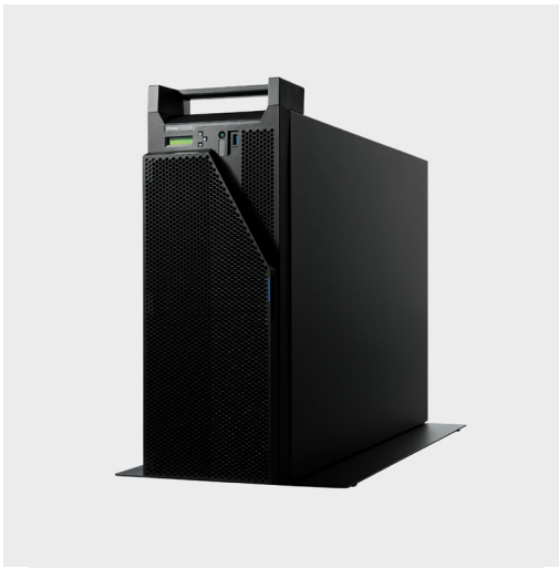
IBM Power S1014