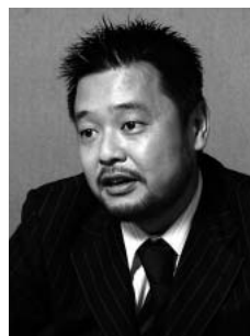
カゴヤ・ジャパン株式会社 代表取締役

The project targeting at the start of its operation in January 2006 is introduced as a case example of IBM Japan's Facility Management Services.