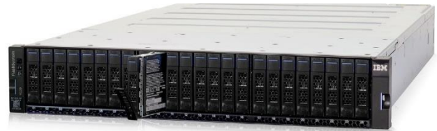
IBM FlashSystem 9100

IBM FlashSystem 9100은 매우 효율적인 2RU(rack-unit) 새시에서 페타바이트 단위의 유효 데이터 스토리지를 제공합니다. 가장 혁신적인 요소 중 하나는 IBM FlashCore 기술을 NVMe 인터페이스를 갖춘 표준 2.5인치 SSD(solid-state drive) 폼 팩터로 구현한 것이며, 24개의 FCM으로 스토리지 어레이의 기반을 형성할 수 있게 되었습니다. IBM FlashCore 기술에 구현된 IBM 혁신 덕분에 IBM FlashSystem 솔루션은 일관성 있는 마이크로초 단위의 대기 시간, 최고의 안정성, 다양한 운영 효율 및 비용 효율의 이점을 제공합니다. IBM FlashCore의 혁신 요소 중에는 하드웨어 가속 NVMe 아키텍처 및 첨단 플래시 관리 기능, 이를테면 IBM Variable Stripe RAID™ 기술, IBM이 엔지니어링한 오류 수정 코드 및 IBM 전용 가비지 컬렉션 알고리즘 등이 있으며, 이러한 요소를 통해 플래시 내구성을 강화하고 성능을 가속화하면서 대기 시간을 단축할 수 있습니다. IBM FlashSystem 9100 어레이는 NVMe-oF(NVMe-over fabrics)뿐만 아니라 새로 상용화되는 스토리지 클래스 메모리 기술에도 대비하면서 IBM FlashSystem 9100 솔루션의 미래를 보장합니다.