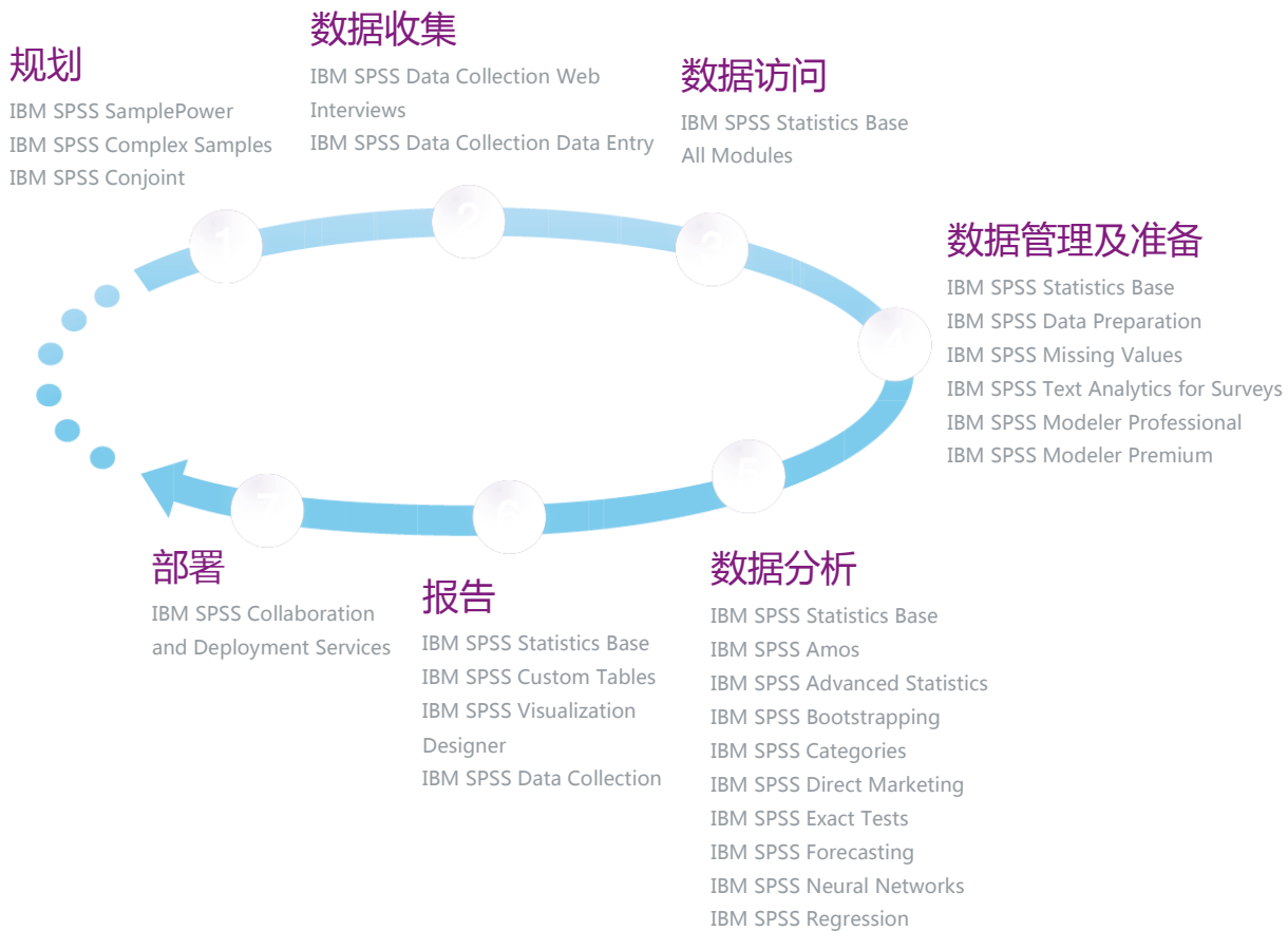
图 1：IBM SPSS Statistics 集成了一系列适用于整个分析流程的功能。

SPSS Statistics 产品家族拥有最全面的适用于整个分析流程的工具。借助多种数据类型的轻松访问以及众多集成模块，分析师可以获得有关其手头任务的必要信息。这款软件的报告和部署功能也为用户提供了洞察力并支持用户更快速、清晰地传达结果。