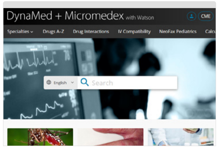
منظر سطح المكتب

IBM وشعار IBM و ibm.com و Watson Health و Watson هي علامات تجارية لشركة International Business Machines المسجلة في العديد من الولايات القضائية في جميع أنحاء العالم. وقد تكون أسماء منتجات وخدمات أخرى علامات تجارية لشركة IBM أو شركات أخرى. كما تتوفر قائمة حالية بعلامات IBM التجارية على الإنترنت في قسم "معلومات حول حقوق الطبع والنشر والعلامات التجارية" على الموقع الإلكتروني: ibm.com/legal/copytrade.