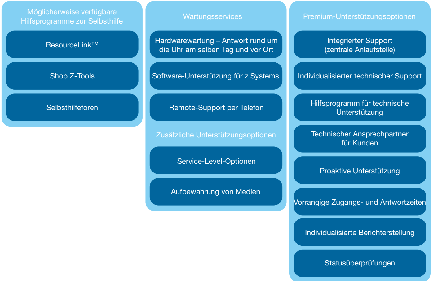
Abbildung 4. Darstellung von möglicherweise verfügbaren sowie optionalen und Premium-Support-Services für Ihre IBM z Systems-Mainframes. IBM behält sich das Recht vor, Angebote, Richtlinien und Verfahren jederzeit zu ändern oder zurückzuziehen.