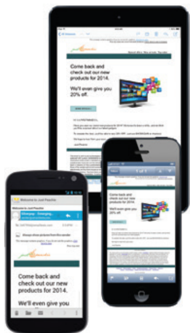
図 1: iPad Mini、iPhone 5、および Android メール のプレビュー