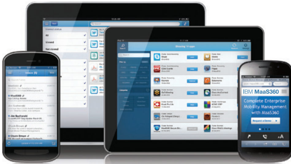
Figura 1: Seguridad y productividad en distintos tipos de dispositivo