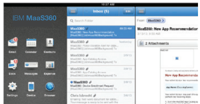
Figura 2: Contenedor MaaS360 con MaaS360 Secure Mobile Mail