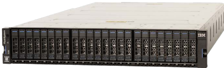
IBM FlashSystem 5100

非揮發性記憶體儲存裝置 (Non-Volatile Memory Express, NVMe) 通訊協定是專為急遽加速資料處理所設計的最強大創新之一。IBM Storage 也藉由將 NVMe 解決方案在整個儲存產品組合中實作，得以不斷地迅速發展。IBM FlashSystem 系列的資料系統已將 NVMe 功能納入其高 端和中型企業適用的 FlashSystem。現在，藉由引進 IBM FlashSystem 5100，IBM 將 NVMe 技術的速度與效率整合進入門級企業產品線，專為各種規模的企業提供成本合理、功能強大、高效能的儲存解決方案。