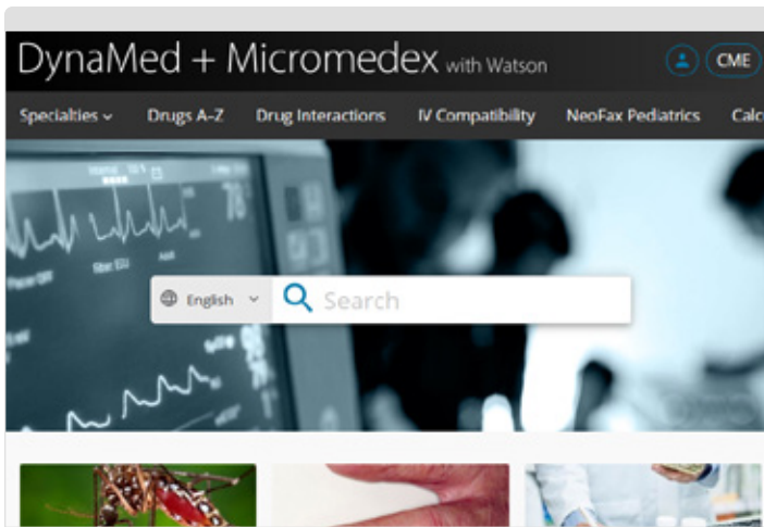
Vista ordenador de sobremesa