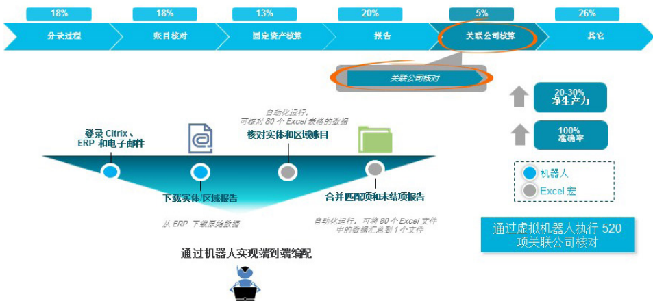
图 1. 关联公司对帐流程