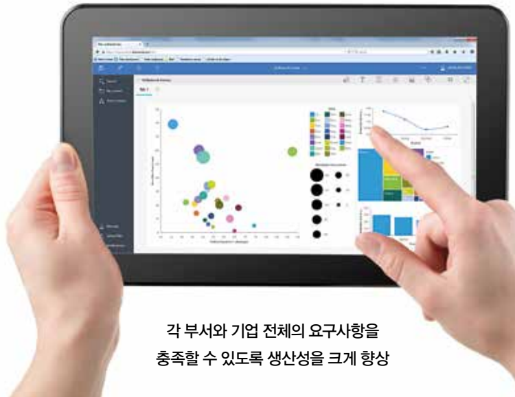
각 부서와 기업 전체의 요구사항을 충족할 수 있도록 생산성을 크게 향상

IBM® Cognos® Analytics는 이러한 요구사항을 처리할 수 있도록 설계된 안내를 통한 셀프 서비스 기능을 제공합니다. Cognos Analytics 플랫폼은 비즈니스 사용자가 개인 또는 작업 그룹의 과제를 자체적으로 해결할 수 있도록 하여 분석에 대한 개인적인 접근법을 제공하는 한편 IT 부서에는 비즈니스 요구사항의 증가에 따라 쉽게 확장할 수 있는 검증된 솔루션을 제공합니다.