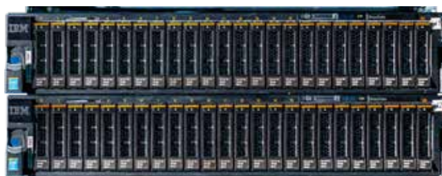
Figure 1 : PureData System for Analytics N3001-001, mini-appliance 5

Basée sur la technologie Netezza, l'offre IBM PureData System for Analytics intègre une base de données, des outils d'analyse, un serveur et des supports de stockage dans une appliance unique et conviviale. La solution ne nécessite qu'une configuration et une administration minimales, et ce, tout en assurant des performances d'analyse rapides et constantes. Elle permet de simplifier considérablement les analyses opérationnelles en consolidant toutes les activités d'analyse dans l'appliance, c'est-à-dire là où se trouvent les données, pour assurer des performances maximales. Visitez le site : ibm.com/PureSystems et découvrez comment notre gamme d'« expert integrated systems » élimine la complexité à tous les niveaux et contribue à créer vraiment de la valeur métier au sein de votre entreprise.