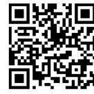
访问 IBM 大数据官网