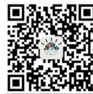
关注 IBM 云公众号

立刻免费咨询 IBM 专家: 400 810 1818 转 2385 (工作日 9:00-17:00), 敬请访问: ibm.com/cn-zh/analytics