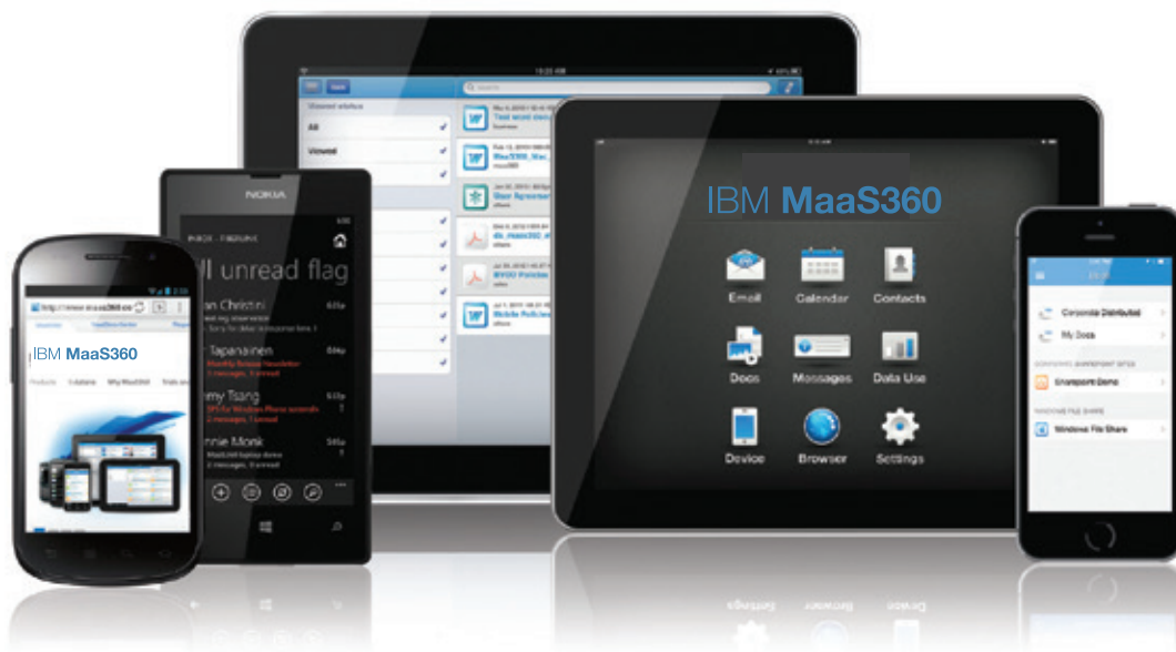
Figura 1: Ejemplos de MaaS360 en varios dispositivos