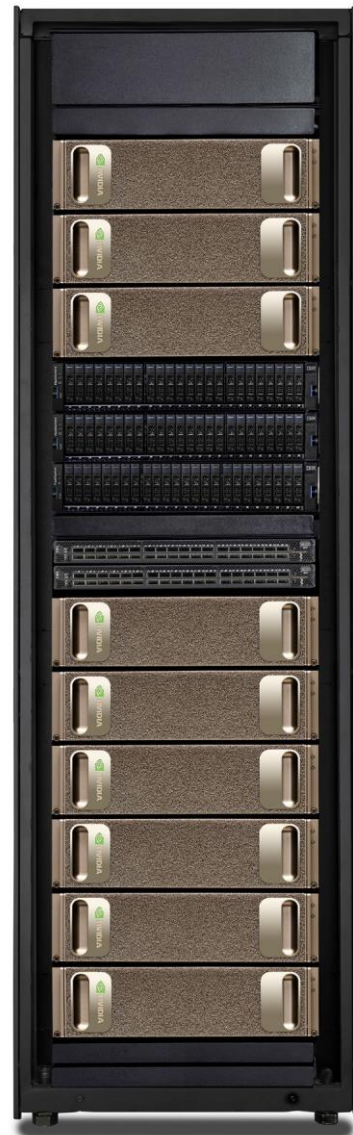
IBM SpectrumAI 与 DGX-1 POD 搭配组合 (9:3 配置)

IBM SpectrumAI 的网络连接由 Mellanox 提供。Infiniband 选项的采用可帮助您实现可靠的 100Gbps 网络连接，充分利用 RDMA 等高级技术。由于规模和配置得当，因此可确保存储吞吐量，还可实现 NVIDIA DGX-1 服务器之间的节点间通信。