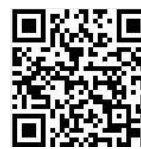
瞭解 IBM Bluemix 平台