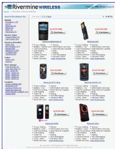
图 4: 移动通讯设备商店