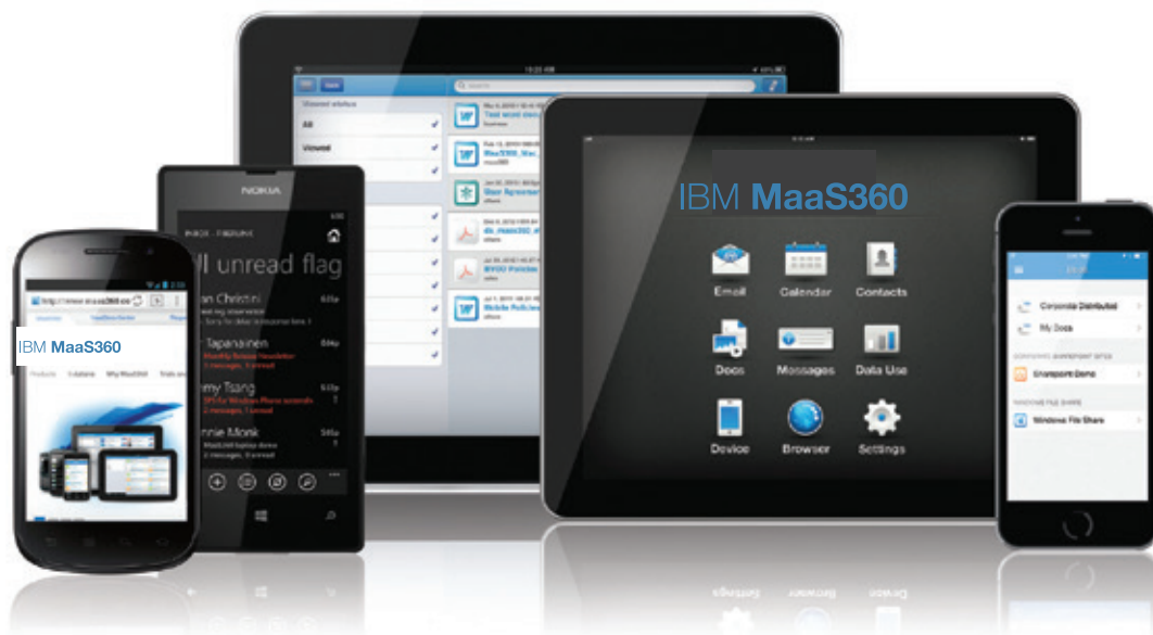
圖 1：各種裝置上的 MaaS360 範例