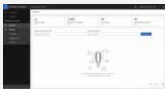
Painel de estoque