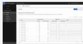
Ajuste do estoque mínimo

Não fique atolado nas épocas de pico — atenda às demandas de pico com a nossa solução SaaS, que oferece dados de estoque atualizados a cada minuto. Essa visão altamente precisa do estoque ajuda a evitar que você prometa mais do que pode entregar, perca vendas e tenha custos inesperados de entrega expressa. Nosso sistema usa gateways Akamai e bancos de dados Cassandra para fornecer visões do estoque nas lojas e nos depósitos, com a velocidade e a precisão necessárias para proporcionar experiências aprimoradas de atendimento ao cliente. Além disso, nossa solução não exige assistência de TI para aumentar ou reduzir a escala conforme as variações de demanda ao longo do tempo, liberando esses recursos de TI para se concentrarem em fornecer melhores experiências para seus clientes.