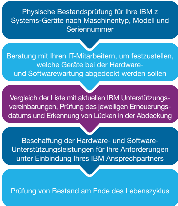
Abbildung 3. Darstellung der erforderlichen Schritte für das Management Ihrer Supportabdeckung.