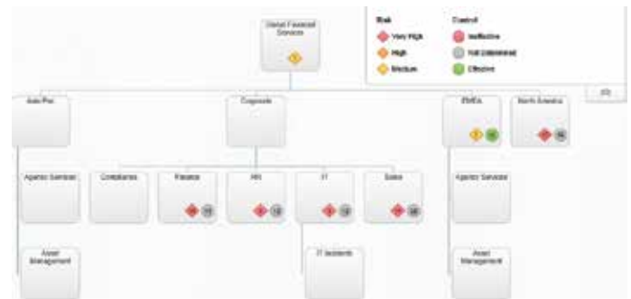
Abbildung 2: Erweiterte Visualisierung: Ganzheitliche Sicht auf Geschäftshierarchien mit visuellen Risikoindikatoren.

Diese Services und Komponenten stellen ein breites Spektrum an Funktionen bereit, die für eine vollständig skalierbare, integrierte Lösung für das Risiko- und Compliance-Management notwendig sind.