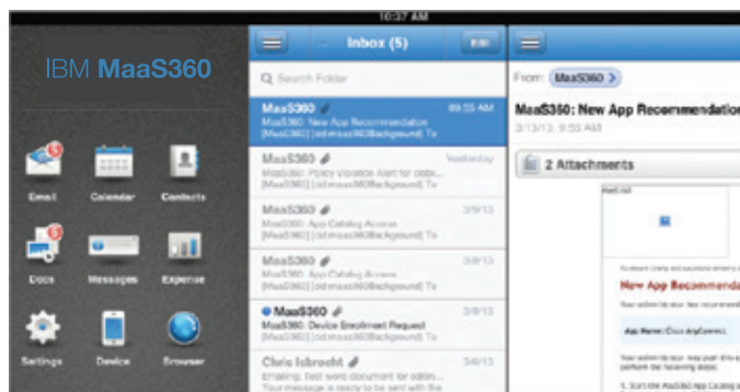
Figura 2: Contenedor MaaS360 con Correo móvil seguro MaaS360