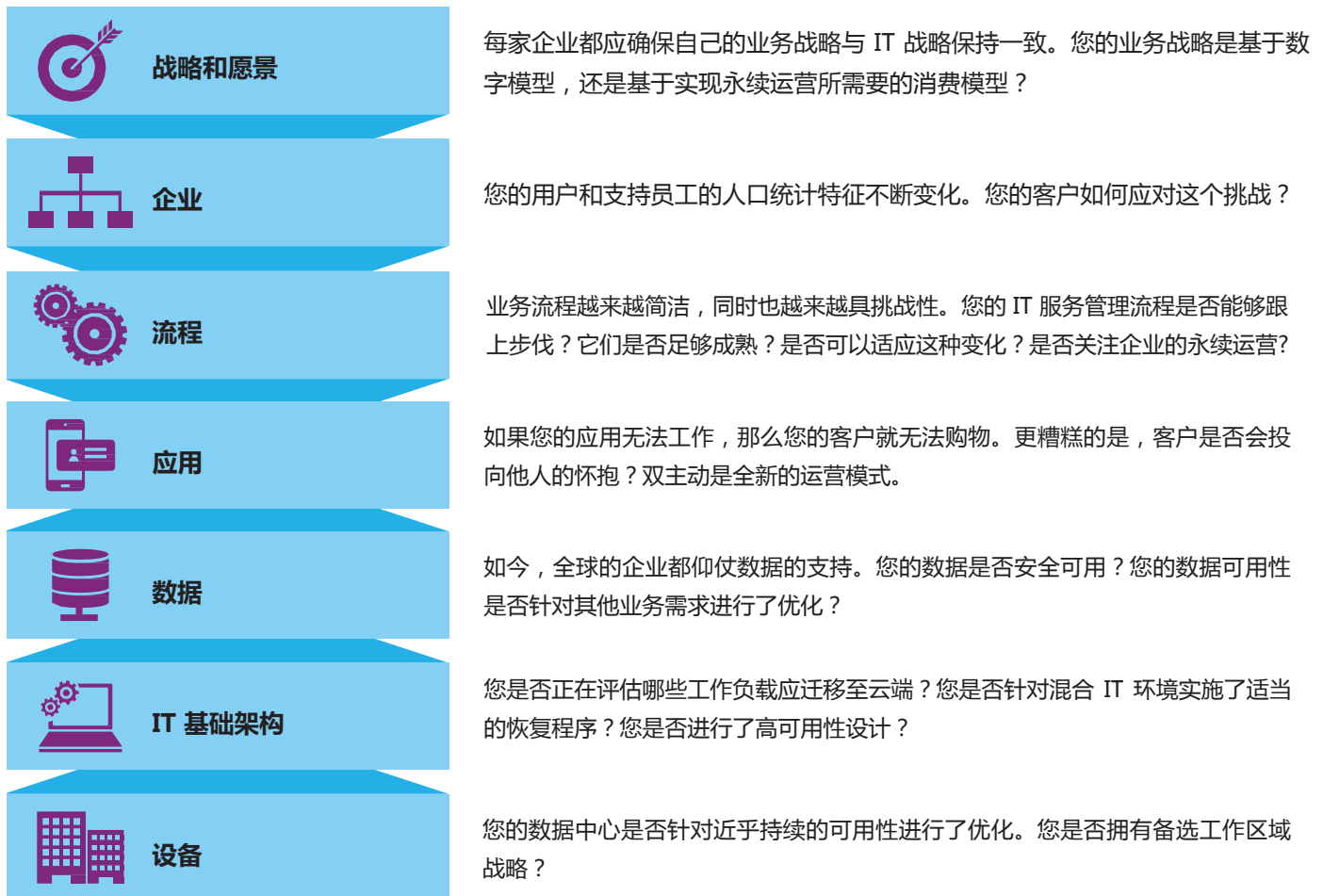
图 1：IBM 业务连续性及灾备服务框架。

作为详细的业务连续计划的一部分，框架中每个层面的运营都必须满足行业和企业业务连续性、灾难恢复、灾备、合规性（如需要）和安全性方面的要求。这些层面相互依赖，所以必须检测每个层面支持其他层面的能力。该方法可以帮助您的企业实现一种由内而生而非后续嵌入的全方位业务连续性。它还可以帮您做好准备，实现永续运营。