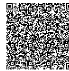
访问 IBM 云官网