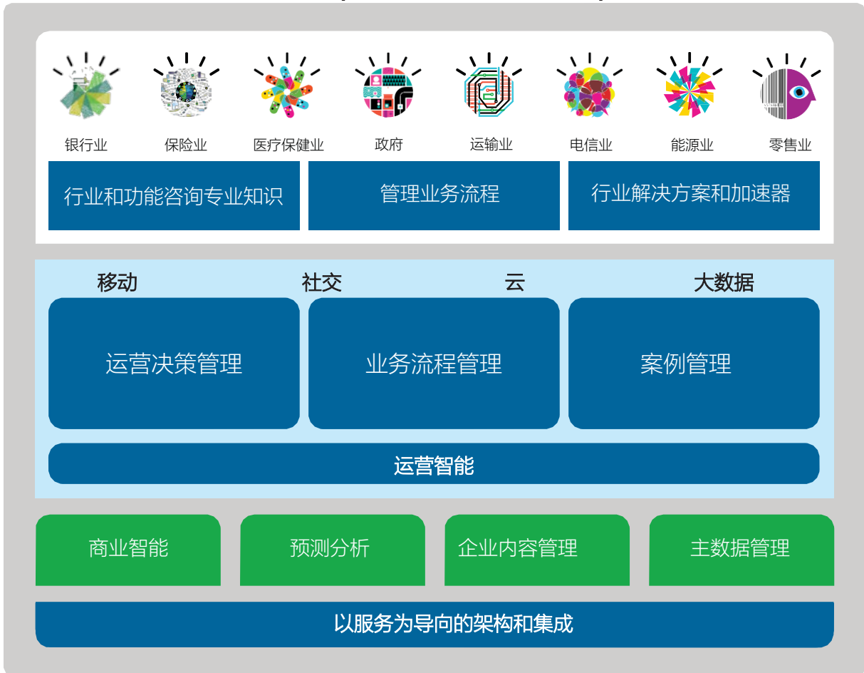
图 1. IBM Business Process Manager 是一种简单、可扩展的集中式流程管理系统，可帮助企业人员优化性能。