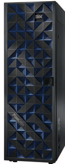
Abbildung 1: PureData System for Analytics

IBM PureData System for Analytics ist ein skalierbares, hardwarebeschleunigtes System für die exklusive Parallelverarbeitung, mit dem der Kunde im Vergleich zu traditionellen Systemen 10-100 mal schneller Erkenntnisse aus riesigen Datenmengen gewinnen kann, 1 ohne dass die Datei hierfür auf einen separaten Analyseserver kopiert werden müssen.