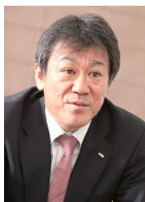
株式会社 LIXIL 理事 Chief Information Officer 兼 情報システム本部 本部長

“業務効率化などの成果により、システム統合にかかった投資分については短期間で回収できる見込みです。インフラのランニング・コストも大幅に削減される見通しで、今後5年間で10億円以上の削減を試算しています。”