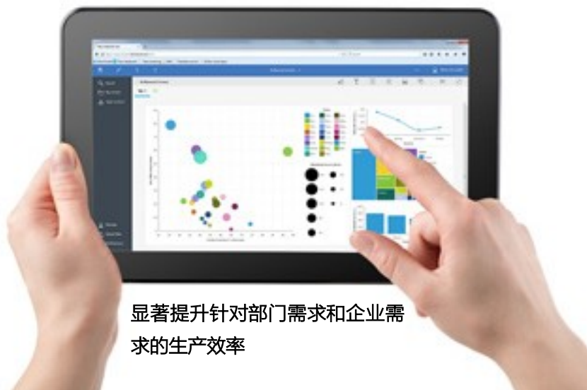
显著提升针对部门需求和企业需求的生产效率

IT： 作为一名 IT 专业人员，您需要在有限的资源和大量的分析请求之间实现平衡。您需要最新的托管分析技术，以确保企业可在不损及治理水平的前提下获得洞察力。Cognos Analytics 通过自助服务功能对 BI 进行了重塑，使得业务用户可在确保可控性的同时充分利用 BI 功能。