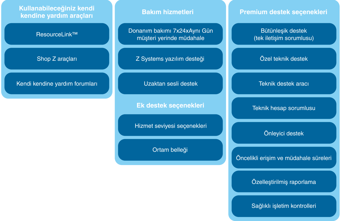
Şekil 4. Mevcut hizmetler ile isteğe bağlı ve premium hizmetler de dahil olmak üzere IBM z Systems anabilgisayarlarınıza yönelik destek hizmetlerini betimlemektedir. IBM; olanaklarını, ilkelerini ve uygulamalarını herhangi bir zamanda değiştirme, tadil etme ya da pazardan çekme hakkını saklı tutar.