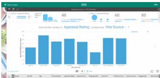
Abbildung 2: Faktoren für Verhaltensweisen und Ergebnisse durch die Suche nach vorrausschauenden Erkenntnissen ermitteln, die in den Daten verborgen sind