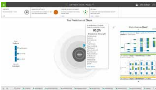
Abbildung 2: Faktoren für Verhaltensweisen und Ergebnisse durch die Suche nach vorrausschauenden Erkenntnissen ermitteln, die in den Daten verborgen sind