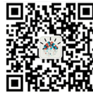
关注 IBM 云公众号

有关 IBM 云更多信息，敬请访问： https://www.ibm.com/cloud-computing/cn/zh/?lnk=ushpv18c2