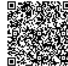
了解 IBM API Connect