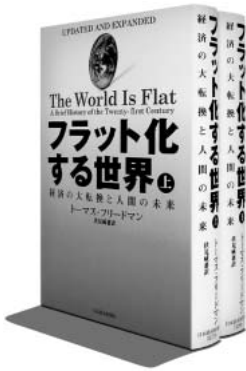
図1. トマス・フリードマン 「フラット化する世界」 日本経済新聞社

グローバル経済は今、急速に進展しています。例えば、30億人という膨大な人口を抱える中国、インド、ロシア、東欧、ブラジルのような新興経済国を考えてみてください。これらの国や地域は、二つの領域において、日本のビジネスに大きな利益をもたらす可能性を持っています。第1に製品やサービスの新たな潜在的市場として、第2に高品質で低価格な労働力の提供の場としての可能性です。特に、この低価格な海外の労働力は、日本企業が製品やサービスの世界市場で競争するための手段を手に入れることが飛躍的に容易になったことを表しています。