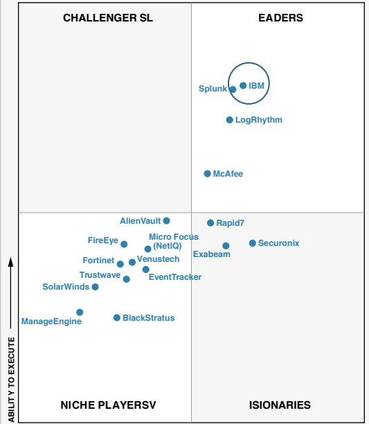
COMPLETENESS OF VISION → As of December 2017