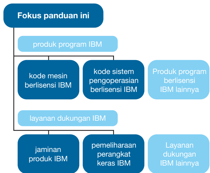
Gambar 1. Meskipun tipe kode komputer berbeda-beda, panduan ini secara spesifik membahas mengenai perangkat lunak sistem pengoperasian IBM (contohnya, IBM z/OS), kode mesin dan layanan dukungan IBM.

Anda mungkin memiliki berbagai sistem, produk berlisensi dan layanan dukungan yang digunakan dalam organisasi Anda. Meskipun pengelolaan berbagai lisensi, pembaruan dan layanan dukungan bisa jadi menantang, Anda bertanggung jawab untuk mengonfirmasi bahwa Anda tetap mematuhi syarat-syarat lisensi IBM atau perjanjian-perjanjian dukungan yang berlaku yang Anda miliki. Panduan ini dirancang untuk membantu memudahkan hal tersebut bagi Anda.