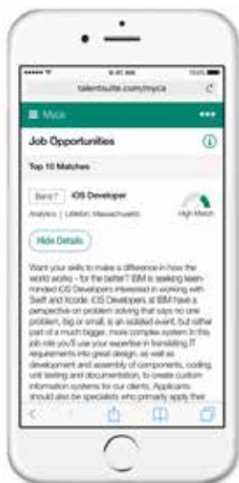
Finde die geeignete Aufgabe und bewirb dich direkt

Die Benutzer können ihre Suche mit Standortfiltern verfeinern und sich direkt vom Watson Career Coach aus bewerben, um ihren nächsten beruflichen Schritt einzuleiten.