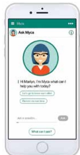
Finde Antworten auf deine karrierebezogenen Fragen

Myca basiert auf IBM Watson und hat Antworten auf über 40 karrierebezogene Fragen sowie auf generelle und unspezifische Standardfragen. Dieser kognitive Bot lernt aus Benutzerfeedback – aus Antworten und zusätzlichen Kommentaren und optimiert die zukünftigen Antworten.