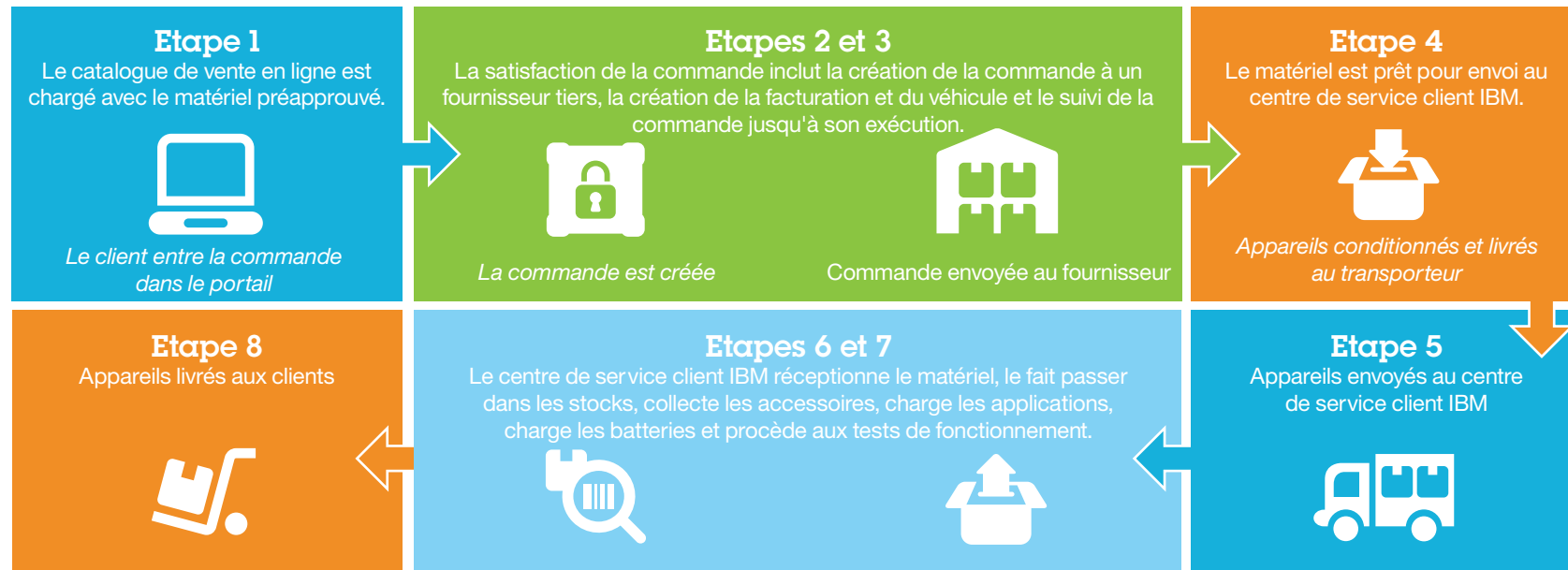
Illustration 1. Ces illustrations décrivent le flux de processus d'IBM MobileFirst Device Procurement and Deployment Services. Le modèle IBM Global Factory explique les étapes 5 à 8 : les appareils sont remis à IBM, configurés et chargés avec votre logiciel, puis fournis à votre entreprise. Ils ont prêts à l'emploi.