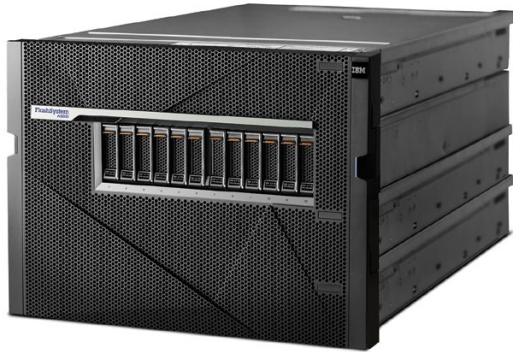
IBM FlashSystem A9000

IBM FlashSystem A9000 e IBM FlashSystem A9000R son sistemas de almacenamiento all-flash, que están diseñados específicamente para ayudar a construir capacidades similares a CSP en prácticamente cualquier negocio.