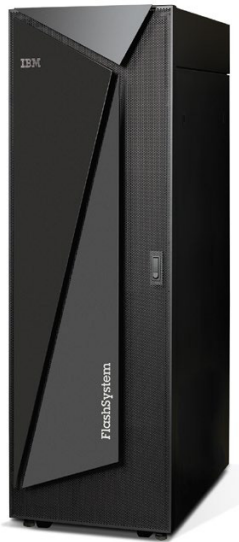
IBM FlashSystem A9000R

Tanto IBM FlashSystem A9000 como IBM FlashSystem A9000R se construyen empleando la tecnología de almacenamiento definida por software IBM Spectrum Accelerate™. IBM Spectrum Accelerate ofrece un conjunto de servicios de almacenamiento maduros que han sido desarrollados con entornos de nube y virtualizados en mente. Gracias a la combinación de estas bases de software con arquitectura de hardware de IBM patentada, estas soluciones proporcionan una funcionalidad crítica de nube, lo que incluye: