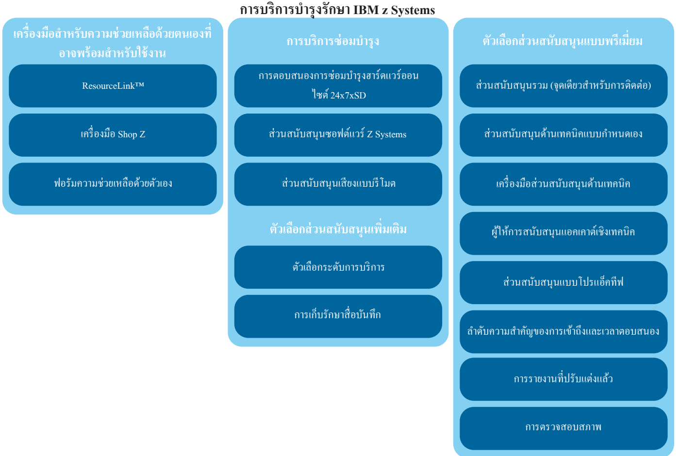
รูปภาพ 4. แสดงให้เห็นภาพของส่วนสนับสนุนการบริการสำหรับเมนเฟรม IBM z Systems ของคุณ – ซึ่งอาจพร้อมให้บริการพร้อมกับตัวเลือกการบริการและการบริการแบบพรีเมียม IBM ของคุณสิทธิ์ในการเปลี่ยนแปลง ปรับเปลี่ยน หรือเพิกถอนข้อเสนอ นโยบาย และแนวทางปฏิบัติได้ตลอดเวลา