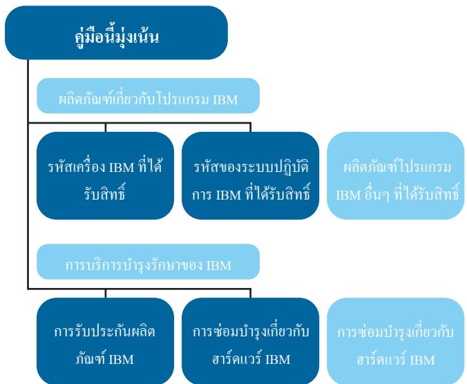
รูปภาพ 1. แม้ว่าจะมีรหัสคอมพิวเตอร์หลากหลายประเภท คู่มือนี้จะกล่าวถึงซอฟต์แวร์ระบบปฏิบัติการของ IBM (เช่น IBM z/OS) รหัสเครื่อง IBM และการบริการบำรุงรักษาโดยเฉพาะ