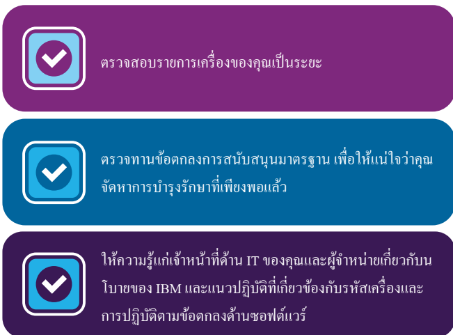
รูปภาพ 5. ตรวจสอบให้แน่ใจอย่างน้อยปีละหนึ่งครั้งว่า องค์กรของคุณยังคงปฏิบัติตามแนวปฏิบัติที่เหมาะสมที่สุดเกี่ยวกับการปฏิบัติตามข้อตกลง