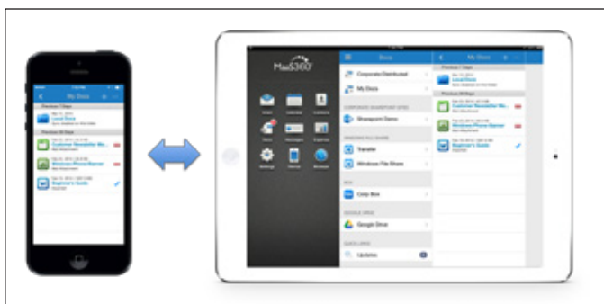
図 4: MaaS360 Mobile Document Sync で、管理されているデバイスに渡るコンテンツの作業が可能に