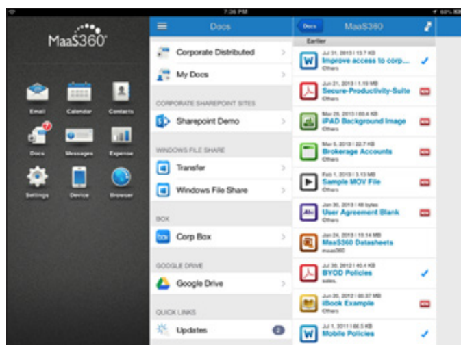
図 1: モバイル・デバイス上のエンタープライズ文書カタログ