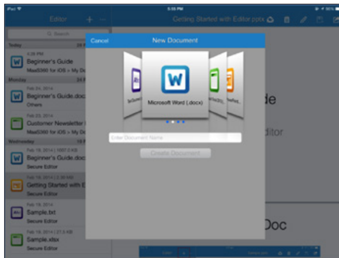
図 3: MaaS360 Mobile Document Editor で、コンテンツを作成、編集、保存