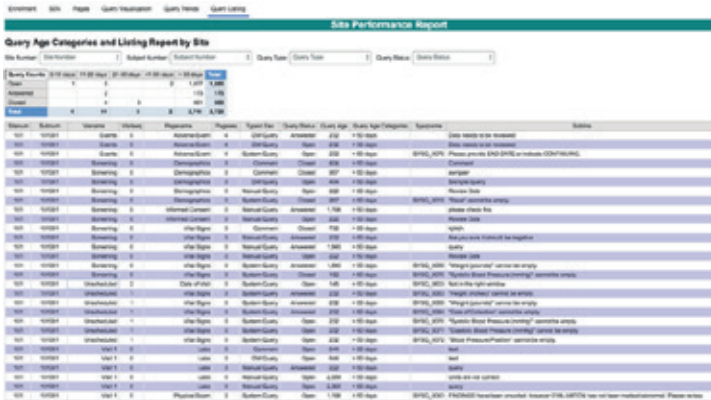
Acima: Visualização da interface de listagem de consultas

A Listagem de consultas oferece vários filtros e uma lista em que um usuário do relatório pode detalhar as informações relevantes às necessidades dele.