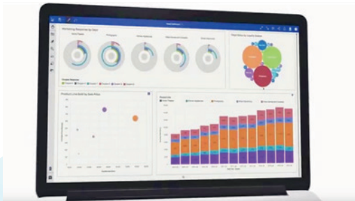
Acima: Visualização do aplicativo Smart Reports