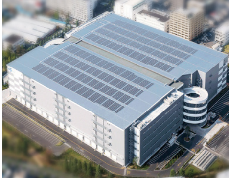
IBM日野工場 リファレビッシュ・センター