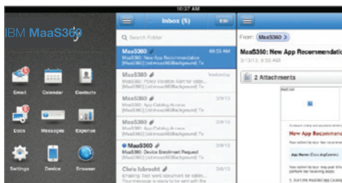
Figura 2: contêiner MaaS360 com MaaS360 Secure Mobile Mail