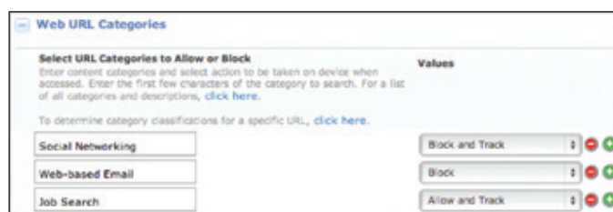
Figura 4: Filtragem de categoria de URL da internet para o MaaS360 Secure Mobile Browser

Para saber mais sobre as soluções de prevenção de fraude da IBM Security, contate o seu representante da IBM ou Parceiro de Negócio da IBM, ou acesse o seguinte site: ibm.com/security .