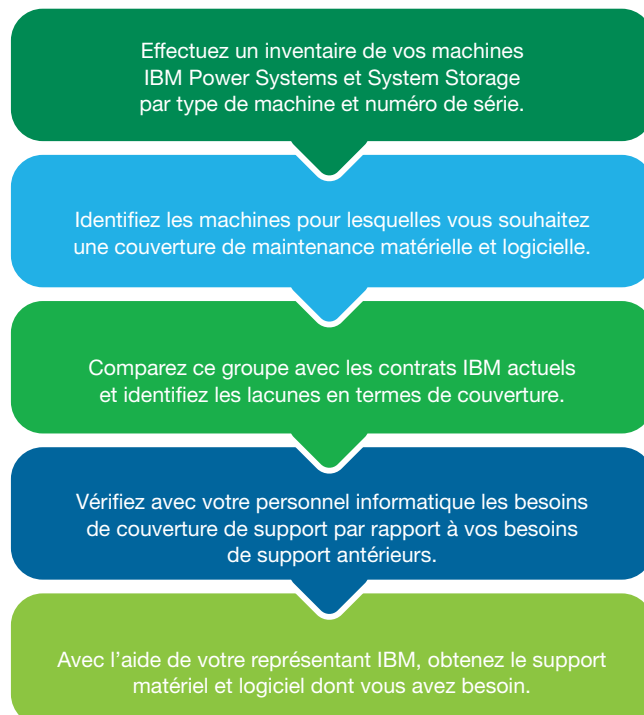
Figure 2. Les étapes d'évaluation de vos besoins en couverture de support pour les systèmes IBM Power Systems et System Storage.