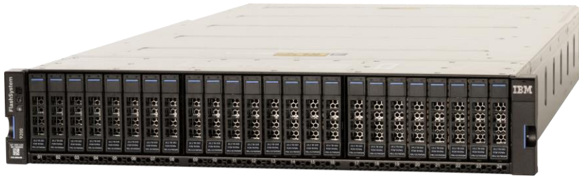
IBM FlashSystem 9200