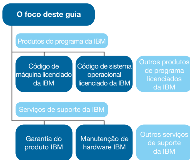
Figura 1. Embora existam diversos tipos de código de computador, este guia trata especificamente do software de sistema operacional da IBM (por exemplo, IBM z/OS), do código de máquina da IBM e dos serviços de suporte.

Provavelmente, na sua organização são utilizados vários sistemas, produtos licenciados e serviços de suporte. Embora possa ser desafiador gerenciar múltiplos serviços de suporte, licenças e atualizações, você é o responsável por garantir a conformidade contínua com os termos do contrato de licença ou suporte da IBM. Este guia foi concebido para facilitar isso para você.