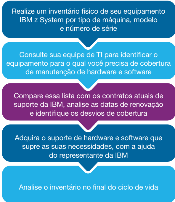
Figura 3. Especifica as medidas a serem adotadas para gerenciar sua cobertura de suporte.