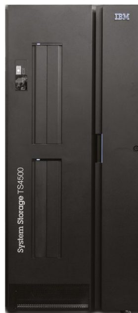
Biblioteca de cintas IBM TS4500

El bastidor de la biblioteca TS4500 ofrece mayor flexibilidad de actualización para los usuarios que desean ampliar su almacenamiento en cintas a medida que aumentan sus necesidades. Las configuraciones de Capacity on Demand (CoD) para los modelos de bastidor TS4500 L incluyen la configuración de “nivel inicial”, una configuración “intermedia” y una configuración de “capacidad básica”. Todos los modelos también son compatibles con las configuraciones CoD de alta definición.