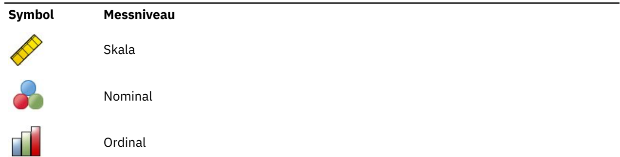
Table 1. Messniveausymbole

Sie können das Messniveau für eine Variable vorübergehend ändern. Klicken Sie hierzu mit der rechten Maustaste in der Liste der Quellvariablen auf die entsprechende Variable und wählen Sie das gewünschte Messniveau im Popup-Menü.